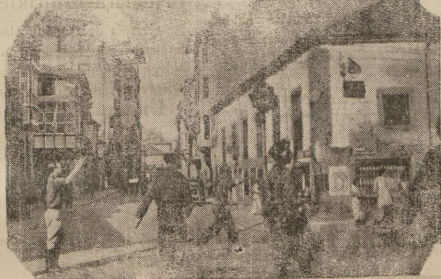
Nankin Japonların eline geçtikten sonra

Şanghay : 17 (Radyo) — Sovyetler birliği, Çin hükümetine büyük yardımlar vadetmektedir. Çünkışig Sovyet hududunda Çin hükümeti tarafından dört bin kilometrelik bir demiryolu inşasına karar verilmiştir. Bütün malzemeyi Sovyetler verecek ve inşaatta Sovyet mühendisleri buluncaktır.